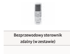
Bezprzewodowy sterownik zdalny (w zestawie)